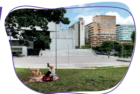
Imagen: foto Ciudad del Río Medellín.

Algunos planes parciales formulados, aprobados y desarrollados en la ciudad, han sido el plan parcial Simesa (Ciudad del Río) y el plan parcial Pajarito (Robledo).