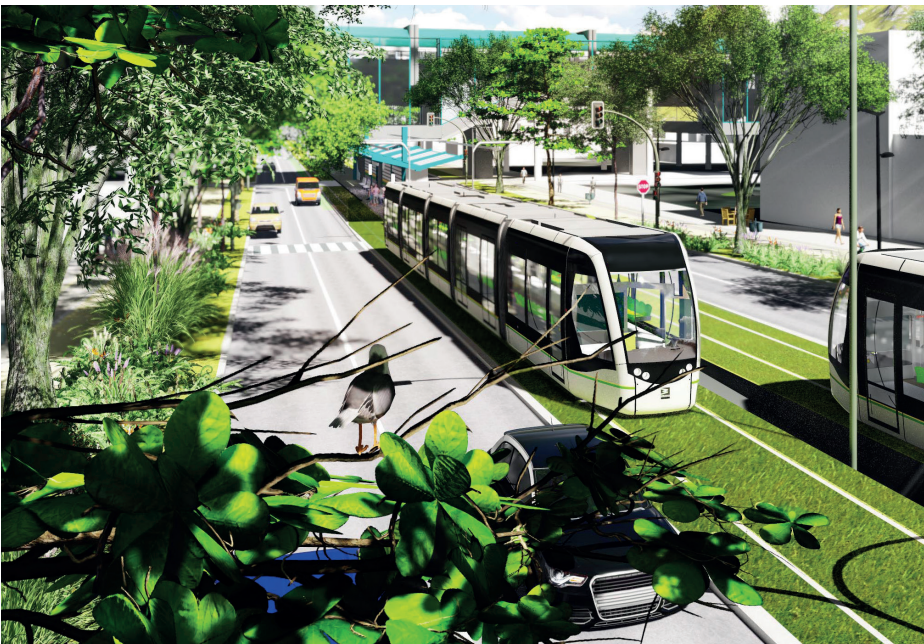
Imagen: rénder del Metro de la 80.

Alrededor del proyecto Metro de la 80 se escuchan muchos términos que no necesariamente son comprensibles para los ciudadanos, un ejemplo es el anuncio del proyecto, una figura que ha sido