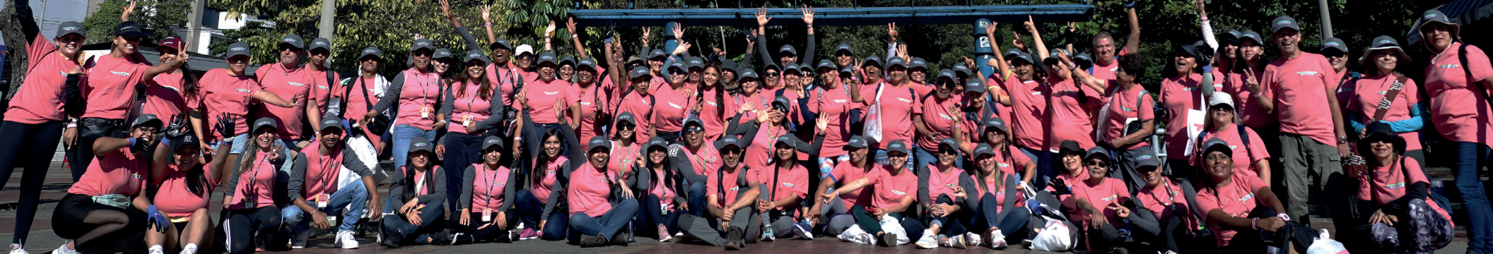
Imagen: alrededor de 100 personas participaron en la Eco-caminata Metro de la 80 recorriendo sectores como El Estadio, La Iguaná, San Germán y el Cerro El Volador.

Tal y como lo habíamos imaginado, nuestra Eco-caminata Metro de la 80 fue todo un éxito. Alrededor de 100 personas de todas las edades y de diferentes sectores de la ciudad, se sumaron a esta iniciativa con la que buscábamos aportar al fortalecimiento de nuestra conciencia ambiental frente al manejo y la disposición