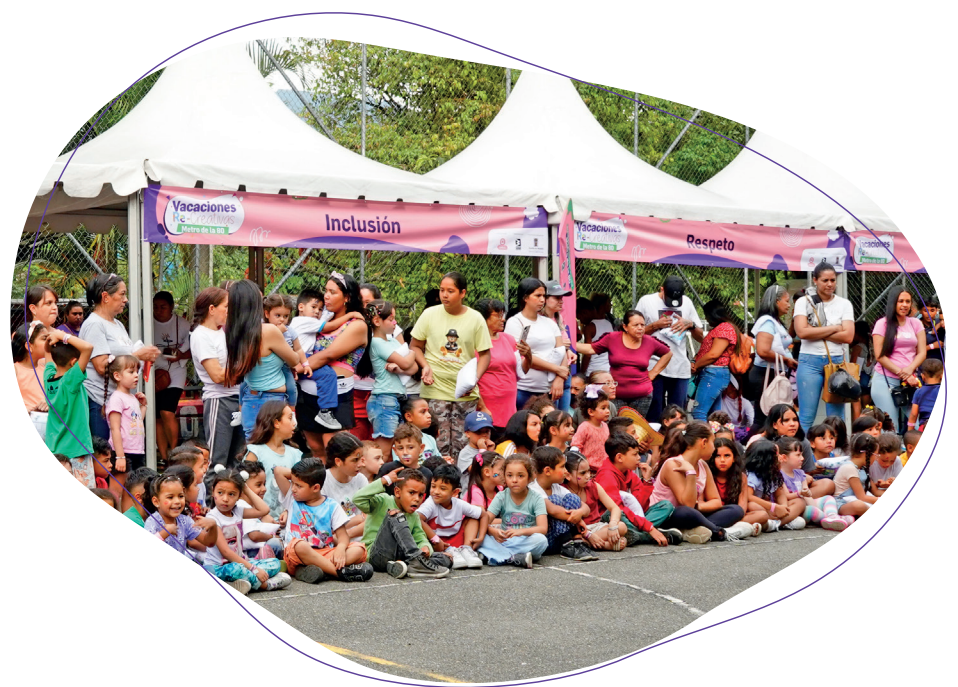
Imagen: vacaciones recreativas comuna 16 Belén

32 actividades ambientales con la participación de 945 personas