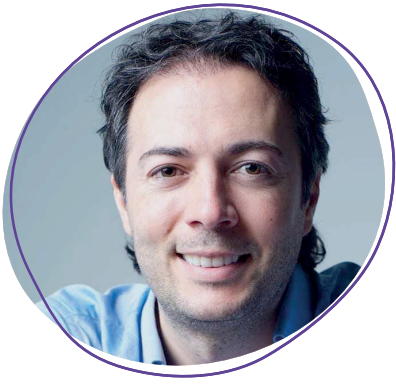
Daniel Quintero Calle Alcalde de Medellín

“Sacamos adelante el Metro de la 80 que va a toda marcha. El proyecto más importante de la ciudad en los últimos 25 años. Empezaremos a ver las primeras intervenciones para transformar este corredor de movilidad, un motivo de celebración que demuestra nuestro compromiso por la Ecociudad.”