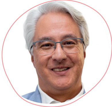
Tomás Andrés Elejalde Gerente Metro de Medellín

El pasado 27 de abril de 2023 firmamos el acta de inicio del contrato principal de obras y suministro de trenes con la Unión Temporal adjudicataria. Los primeros compromisos de este contratista consistieron en presentar tanto el cronograma de obra como sus equipos de trabajo para iniciar las primeras actividades.