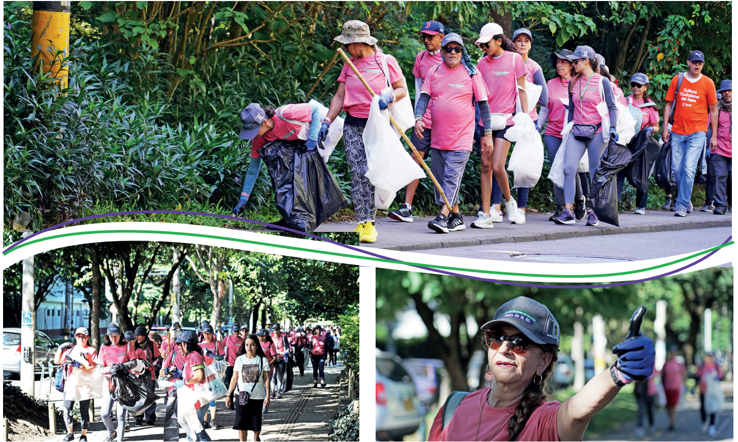
Imagen: durante la Eco-caminata las personas pudieron compartir, disfrutar de un día soleado y al final contemplar la ciudad desde el Cerro El Volador.

Agradecemos a todas las personas que participaron y también a las entidades que se sumaron a esta iniciativa como EMVARIAS, el INDER, la Policía Nacional y administración Cerro El Volador que con su aporte, hacen posible continuar construyendo el sueño de una Medellín donde primen valores como la sana convivencia y el respeto.