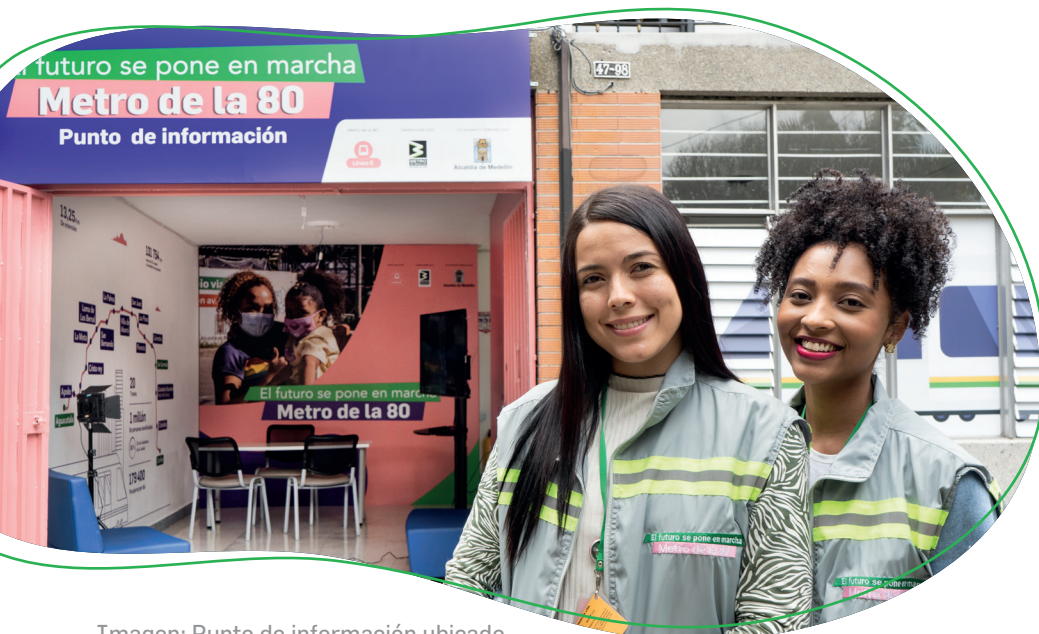
Imagen: Punto de información ubicado en la carrera 81 # 47-98.