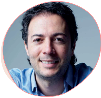
Daniel Quintero Calle Alcalde de Medellín

“En Medellín siempre soñamos hacia adelante, queremos que todas las comunas tengan movilidad inteligente; por eso seguimos proyectando más metrocables, el Tren del Río con Parques del Río y nuevas líneas de Metro atravesando la ciudad con recorridos diferentes. La movilidad tiene que seguir avanzando con el espíritu de la Ecociudad para mejorar la calidad de vida de cada persona”