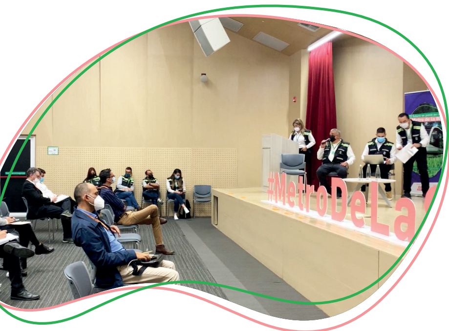
Imagen: Reunión informativa con interesados en construcción del proyecto llevada a cabo el 25 de febrero de 2022.

Según el cronograma del proyecto, se espera adjudicar el contrato en noviembre del presente año.