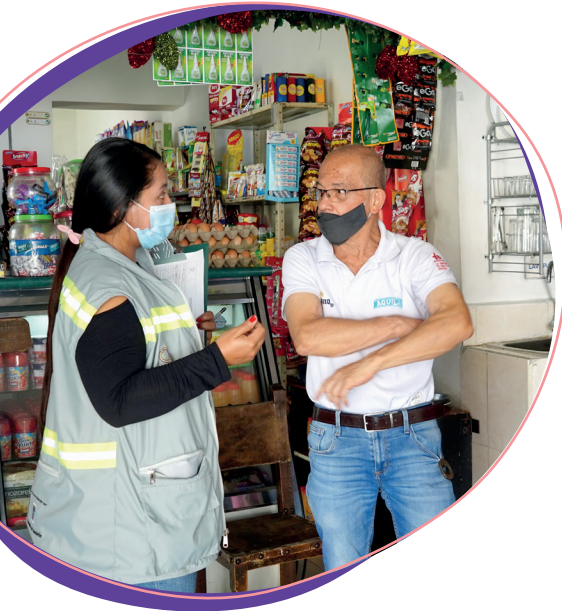
El equipo de gestión social visitó a los comerciantes del corredor vial para presentarles el proyecto.