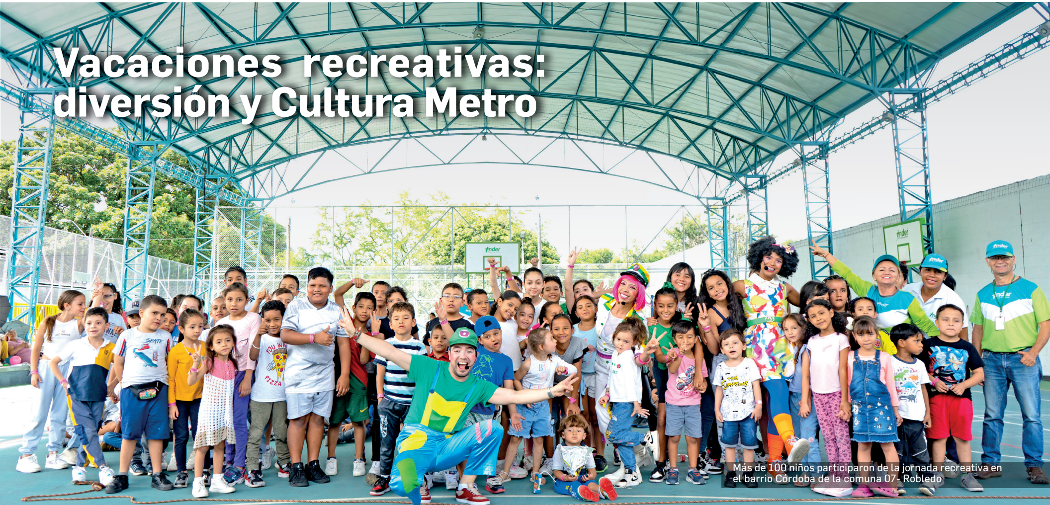
Más de 100 niños participaron de la jornada recreativa en el barrio Córdoba de la comuna 07- Robledo.

Como lo hemos venido haciendo desde el año 2021, nuevamente el período de vacaciones escolares de mitad de año se convirtió en el momento propicio para compartir con los niños del occidente de la ciudad en torno a la diversión, la apropiación del conocimiento y los valores que promovemos alrededor de la Cultura Metro .