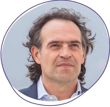
Federico Gutiérrez Zuluaga Alcalde de Medellín

En nuestro Plan de Desarrollo 2024-2027, Medellín Te Quiere, que nos traza la ruta de trabajo para el cuatrienio, quedó el Metro de la 80 como un proyecto fundamental para la movilidad y transformación urbana, social y ambiental de nuestra ciudad, incluidos los intercambios viales previstos para que esta obra tenga un verdadero impacto positivo en la calidad de vida de las personas.