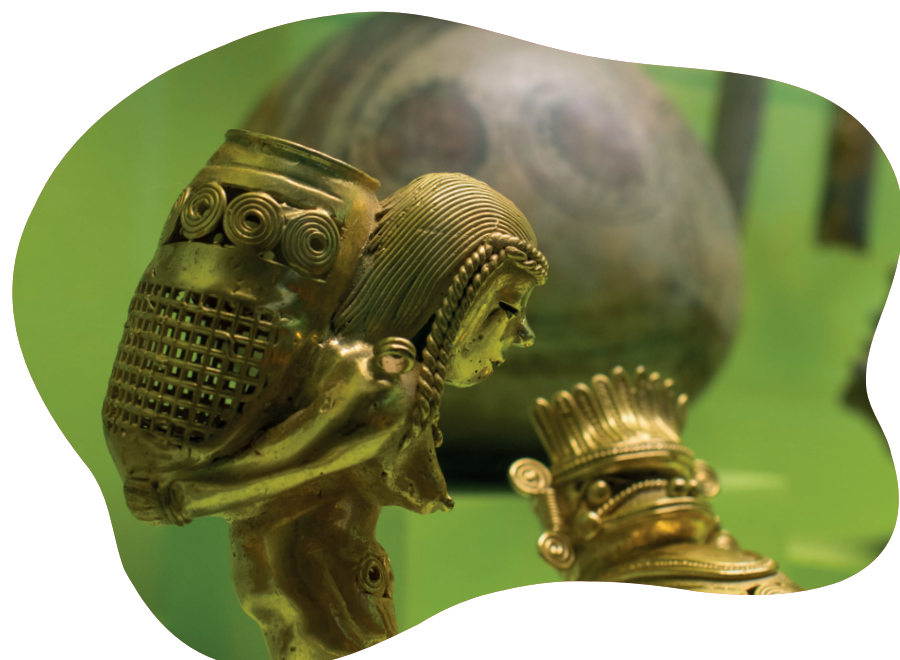
Exposición Orígenes, compuesta por 220 piezas de arte prehispánico en el Museo Fundación Aburrá.

El diario acontecer está poblado de situaciones, lugares y personas con las que se va construyendo sin que a veces seamos muy conscientes de ello, el significado de ese territorio que es el barrio, con sus contornos definidos y experiencias siempre en expansión. Con solo ser bienvenidos en uno de estos espacios familiares, se multiplican las historias que dan forma a lo cotidiano.