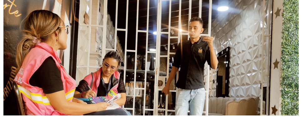
Profesionales de la gestión sociopredial en territorio.

Llevamos oferta institucional acorde a las necesidades, brindamos espacios de formación para fortalecer los procesos productivos y personales y generamos diferentes encuentros de participación para resolver las inquietudes que se presentan en el proceso.