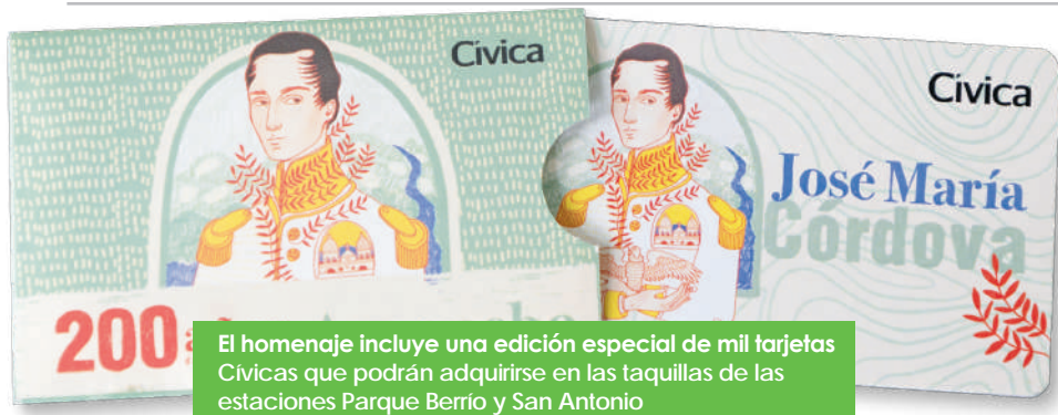
El homenaje incluye una edición especial de mil tarjetas Cívicas que podrán adquirirse en las taquillas de las estaciones Parque Berrio y San Antonio

Este 27 de noviembre se inauguró un nuevo Tren de la Cultura en homenaje al héroe antioqueño José María Córdova, en el marco de la conmemoración del bicentenario de la Batalla de Ayacucho.