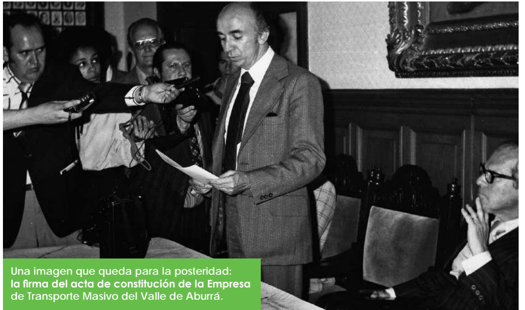
Una imagen que queda para la posteridad: la firma del acta de constitución de la Empresa de Transporte Masivo del Valle de Aburrá.