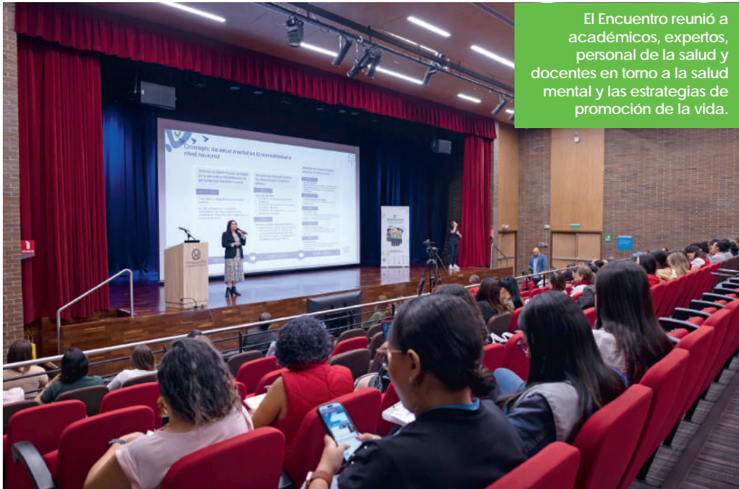
El Encuentro reunió a académicos, expertos, personal de la salud y docentes en torno a la salud mental y las estrategias de promoción de la vida.

La Mesa Metropolitana de Salud Mental liderada por el Metro de Medellín y que reúne a Gobernación de Antioquia, las secretarías de salud de los municipios del área metropolitana, el AMVA y el municipio de San Roque como invitado, realizó el 22 de noviembre en el auditorio de la Universidad CES el Segundo Encuentro Académico de la Salud Mental y la Prevención del Suicidio .