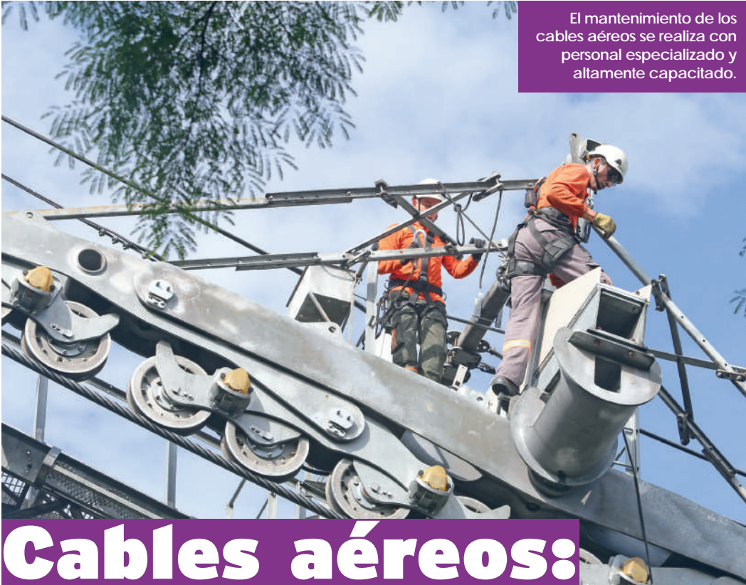
El mantenimiento de los cables aéreos se realiza con personal especializado y altamente capacitado.